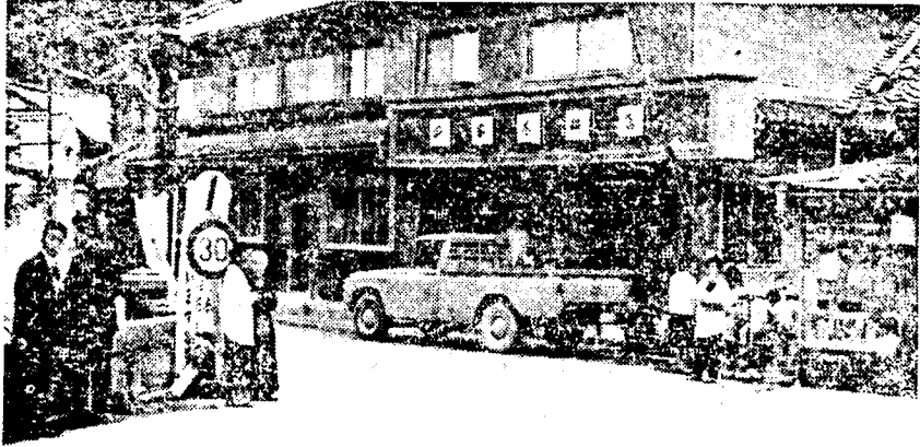
千代橋上から見た、かつての芳月楼（現在、衣料店）。

た。佐倉峠を越え、鷺家口から川に沿って南へ下る路は、やがて川の左岸に移り、カーブを描いて緩い下りで、鷺家口の北のはずれに入る。しばらく行くと、上市から来る国道が鷺家川に架る千代橋を渡ったところで、宿場を貫く街道とT字形に合する。このT字の突当りに芳月楼が道路に面して立っていた。この家から見れば、橋は路を隔てて真向いである。橋の下は、岩盤が