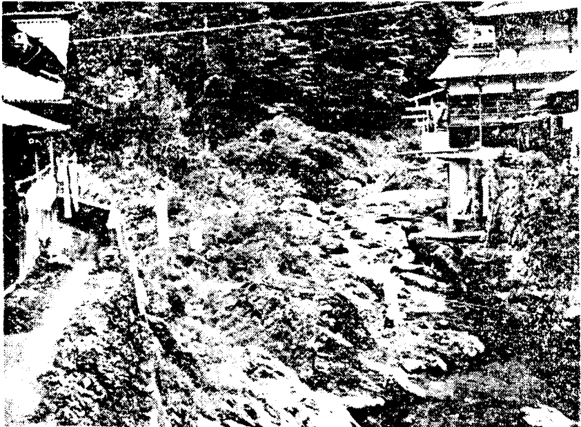
千代橋上から上流に向かって見た鷺家川。左方の岩上に「天誅義士 穴戸弥四郎先生戦死之地」と刻した石碑がある。

た。佐倉峠を越え、鷺家口から川に沿って南へ下る路は、やがて川の左岸に移り、カーブを描いて緩い下りで、鷺家口の北のはずれに入る。しばらく行くと、上市から来る国道が鷺家川に架る千代橋を渡ったところで、宿場を貫く街道とT字形に合する。このT字の突当りに芳月楼が道路に面して立っていた。この家から見れば、橋は路を隔てて真向いである。橋の下は、岩盤が